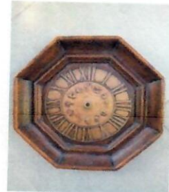
Alle Zeit für uns