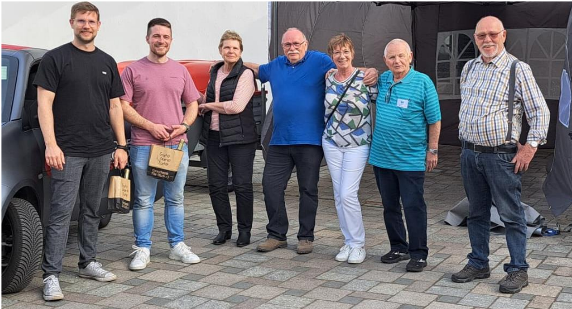
Ein Teil der eingesetzten Helfenden

hätten noch mehr Besucher den Weg zu uns gefunden, wenn die Tische nicht den Blick und den Zugang zum Rathausplatz erschwert hätten.